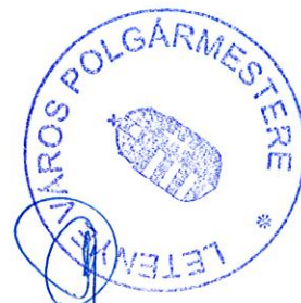
Farkas Szilárd polgármester