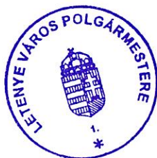
Vida László polgármester